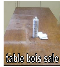
table bois sale